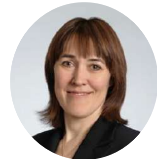
Замглавы Минобрнауки России Петрова О.В.

Реализуемая система федеральных инновационных площадок Минобрнауки России сегодня оказывает всестороннюю поддержку педагогическому сообществу – реализуемая инновационная площадка выступает организатором профессиональных конкурсов и мероприятий, разрабатывает педагогические учебники и пособия, оказывает информационную, правовую, методическую и информационную поддержку работникам образования и реализует и иные важные задачи в системе образования.